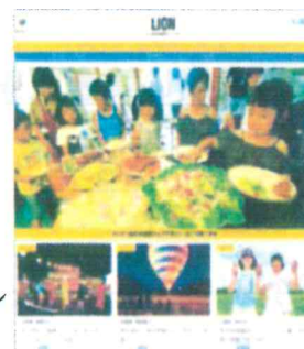
●ライオン誌ウェブマガジン (サンプル)

※ライオン誌及びライオン誌ウェブマガジンは、各クラブからの投稿を募集しております。 クラブの活動レポートを積極的に本誌へお寄せください。(送付先: edit@thelion.jp )