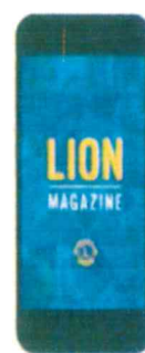
●ライオン誌アプリ (日本語版は近日完成予定)