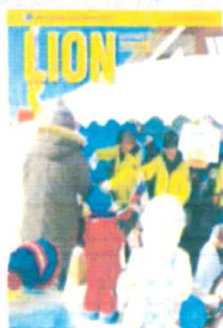
●ライオン誌1-2月号 (サンプル)