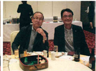
2017年9月28日(木)18:15~ 9月第二例会(美咲ホテルスエヒロ)