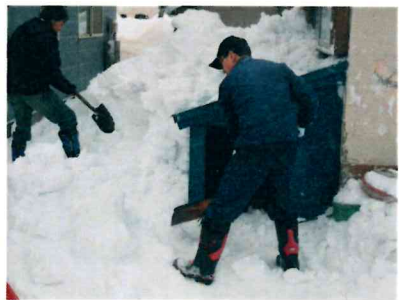
◎例会出席、アクティビティ参加ご苦労様でした。